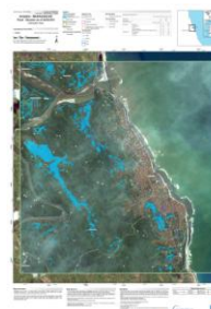
Antalaha – 20/03/2018