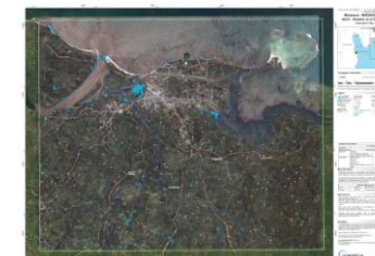
Mananara – 20/03/2018