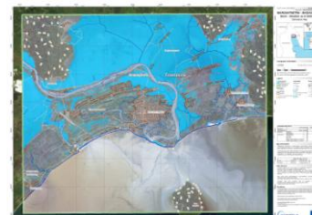
Maroantsetra – 20/03/2018